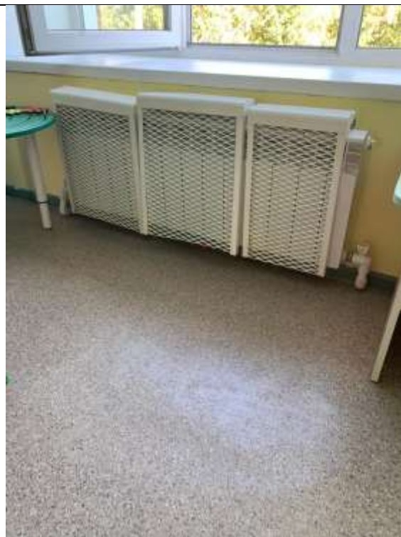
Группа № 8